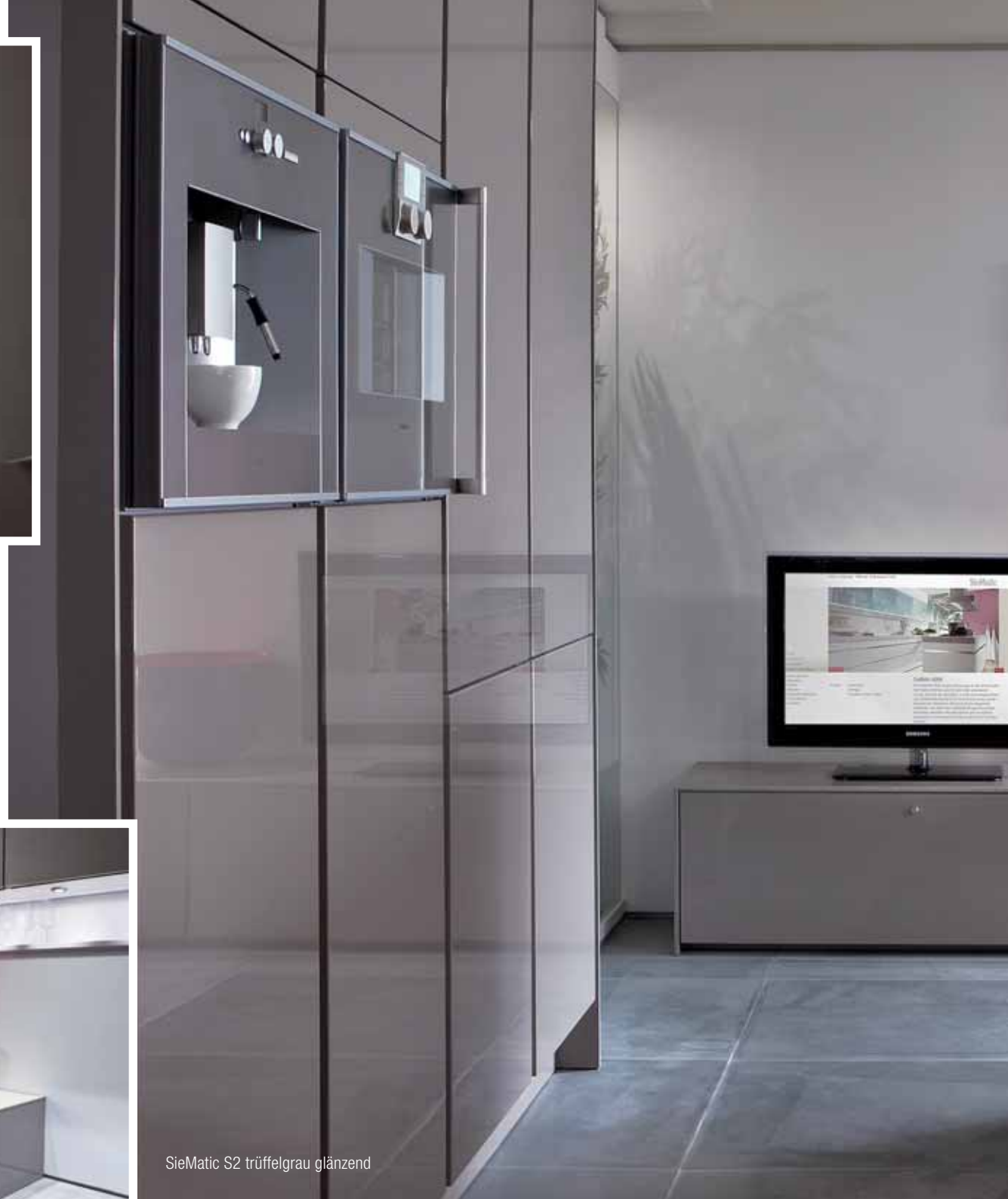
SieMatic S2 trüffelgrau glänzend